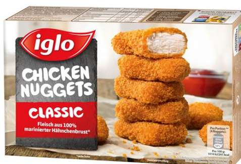
Codes auf der Verpackung